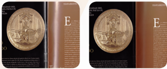
Sistema de controle de brilho