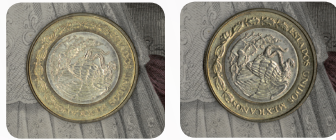
Aprimoramento de relevo