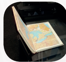
Opcional V Book Holder (2xA2 or 2xA1)